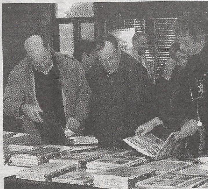
Le rendez-vous des passionnés.