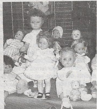
Les collectionneurs de tourne-disques ou de poupées pouvaient trouver leur bonheur à Liancourt.